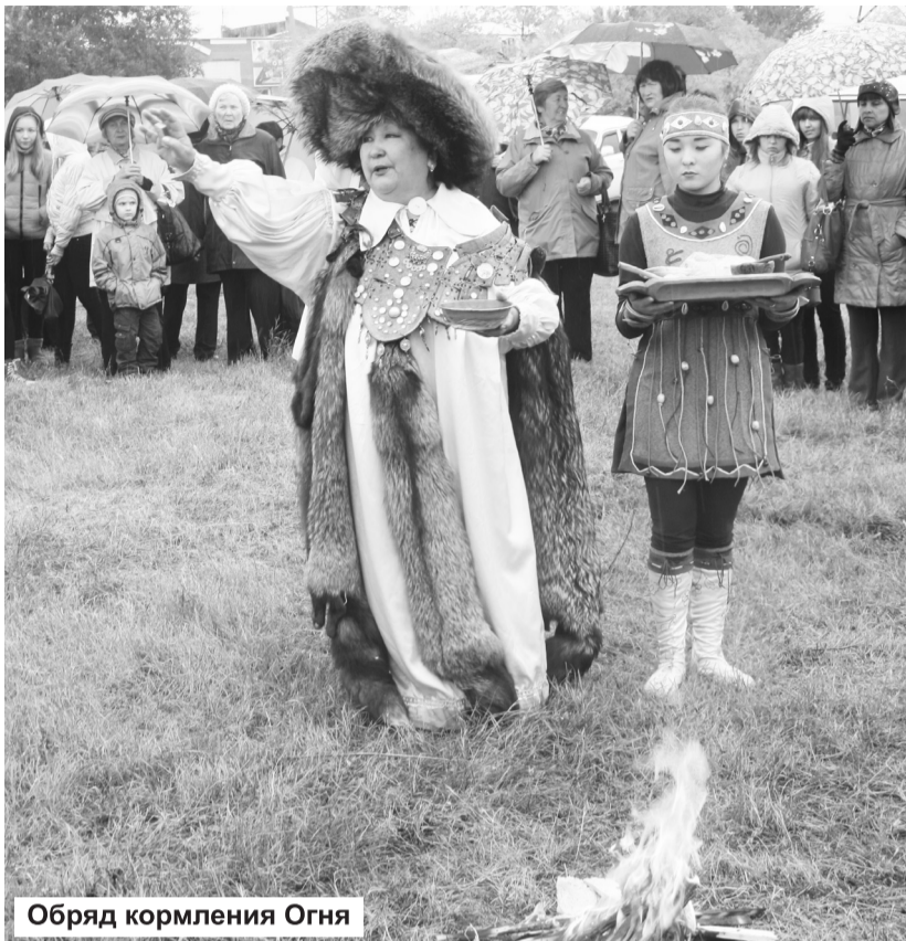
Обряд кормления Огня

Непогода не помешала любителям истории родного края прийти на набережную, чтобы вновь окунуться в эмоционально-духовную атмосферу фольклорно-обрядового действия. Ее создавали такие неперенные атрибуты хакасской культуры, как коновязь, украшенная разноцветными лентами - чалама, юрта, в которой посетители могли посмотреть бытовую утварь и познакомиться с традициями семейного уклада хакасов. А также костры, на жару которых раскаляли бока большие котлы. Аромат съестного вызывал аппетит и подсказывал, что непременно будет угощение традиционными национальными блюдами хакасской кухни: супом «угре», кашей «потхэ» и любимым ребятей и взрослыми лакомством - «талган».